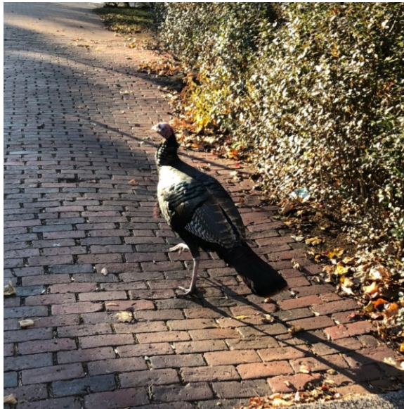
Figure 2:Thanksgiving Day 二日後に通学路で見かけた、今年も難を逃れた(?)と思われる七面鳥です。