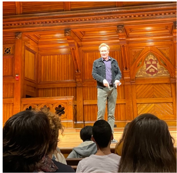
Figure 3:ハーバード大学卒のテレビ司会者コナン・オブライエン氏がサプライズ訪問した時の様子です。