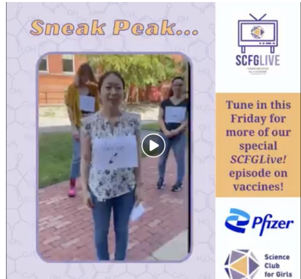
Figure 5: アウトリーチの一環としてワクチンの役割についてのビデオ作りに参加しました。