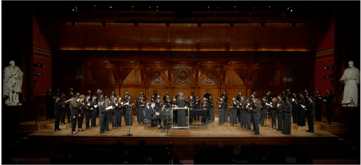
Figure 1:先日参加した合唱団のコンサートの様子です。マスクをしたまま何時間も歌う練習をすることで肺活量が飛躍的に向上しました。