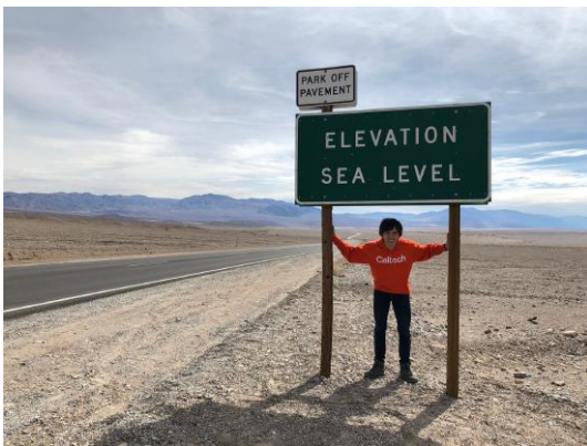
Fig.3 デスバレーの海拔 0m の場所！