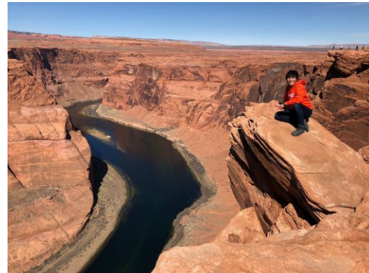
Fig.2 ホースシューベント