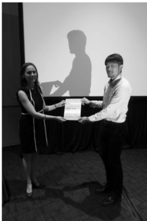
図 2 シンポジウムの最後にあった授賞式（Wiley 賞）

私の発表のタイトルは「Bimodal Phase-Matching in Nonlinear Photonic-Plasmonic Waveguides」ということで、導波路中における非線形効果の位相整合について発表を行いました。具体的にどのようなことをやっているかは次の章で説明したいと思いますが、「プラズモン構造と光導波路を利用して第二高調波発生を効率的に行った」というのが発表の要点です（詳細は後述します）。プラズモニクスの中でも若干変わった発表だったので、スライドの準備に苦戦しました。発表時間が短い中で自分の主張を簡潔にわかりやすく説明するために、できるだけシンプルな図を作り、先輩たちの前で発表してアドバイスを貰って改善してきました。その甲斐あってか、Plasmonics Symposium のスポンサーである Wiley から賞を頂くことができました。図 2 の写真はプロジェクターで顔が青くなっていたので白黒に変換しています。