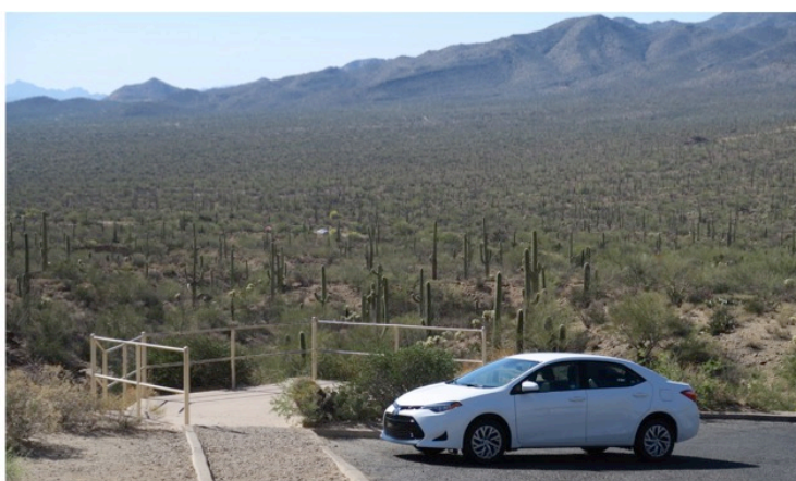
図 3 (左)University of Arizona (右)Tucson の砂漠地帯