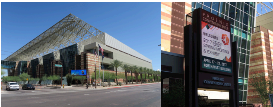
図1 MRS会場のPhoenix Convention Center

私は光学材料の中でもプラズモニック材料、メタマテリアルのシンポジウムで発表をしてきました。私の主な研究分野はプラズモンやメタマテリアルを使わない誘電体の導波路なのですが、一部のプロジェクトでプラズモン構造を使