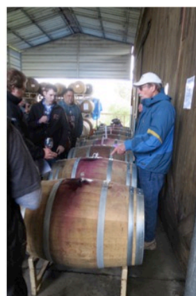
図 5 Sonoma の Barrel Tasting(新作ワイン飲み放題)