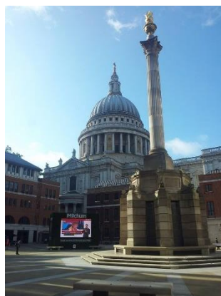
Brexit から一夜明け、取引開始前の ロンドン証券取引所前の広場と St.Paul 大聖堂

Brexit となり、予想通りのポンド安、ユーロ安、株価下落などが今まさに起こっていますが、今後どうなっていくかは本当に不透明です。少なくとも言えることは、中央銀行は協調して市場の不確実性に対処していかなくてはならない(インフレ圧力のある中での金融政策)ということと、政府は政治の混乱が経済に与える短期的な影響を最小限に留めることが必要だということです。国際経済のモデルはいくつかのショックに対してある程度の数量的予想を出すことは可能ですが、政治の混乱という大きなリスクを考慮することは難しく、決して完全に予見することはできません。ましてこの流れが他の EU 諸国に波及していき、世界経済にどのように影響していくか、ともなると未知数です。それでもなお、データと理論に基づいて将来のリスクについて評価をしていくために、研究をしていかなくてはなりませんし、この Brexit という歴史的な選挙を目の当たりにすることができたのは、その意味において幸運なことだと思っています。